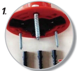
1. เตรียม พุกและหัวสกรู สำหรับติดตั้ง 3 ชุด