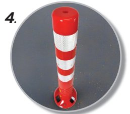
4. พร้อมใช้งาน