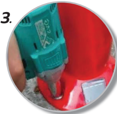
3. ยึดสกรูกับพื้นให้แน่น (กดเปิดสวิตช์ไฟด้านล่างก่อนติดตั้ง)